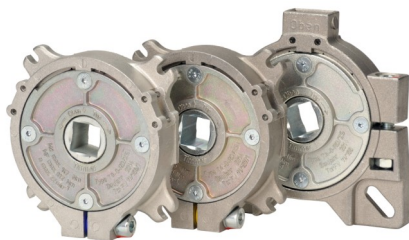
Ta0-RD/XS, TA0-RD/XS, TA0-RD/ZS