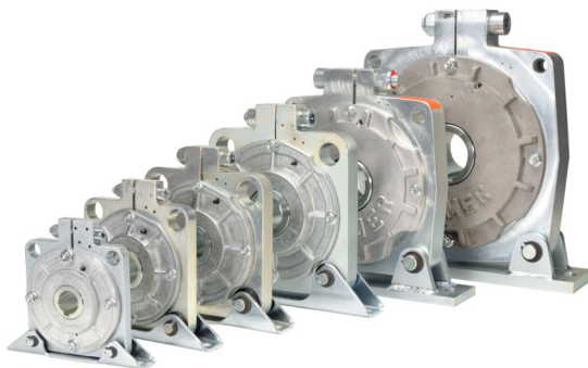
TA1-2-RD bis TA6-RD

Josef Timmer Handels- und Beteiligungs-GmbH Im Weizenfeld 4 D – 59556 Lippstadt-Benninghausen Bei Fragen helfen wir gern — (0049) 2945 969 369 0